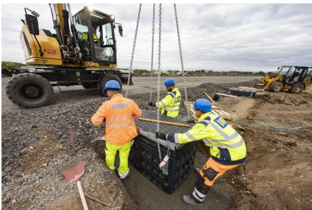
Präzision unter Zeitdruck: Eng getaktete Abläufe und zuverlässige Logistik sichern den reibungslosen Flugbetrieb während der Sanierung.