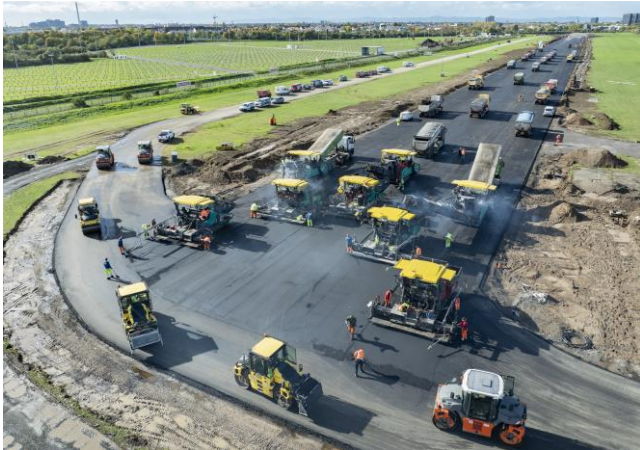
Die Start- und Landebahn des City Airport Mannheim wurde in nur zwei Wochen generalsaniert.